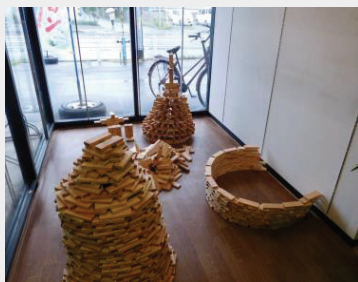
【写真】苫小牧広域森林組合で製作した積み木 (当JAの「生ハスカップ収穫祭」で子供たちが楽しみました)

くらしに地域の木材や食材を意識的に取り入れ、より一層の地材地消・地産地消をしませんか？