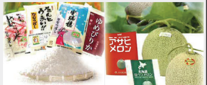
【写真】当JAの特産品 (お米) (メロン)